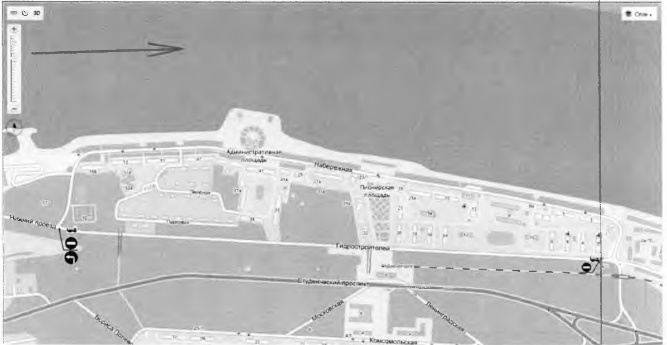
Схема организации маршрутов объезда места введения ограничения На период проведения Всероссийского Дня бега «Кросс Нации – 2022», на территории города Дивногорска, по ул. Набережная им В.И. Ленина, 18 сентября 2022 года.