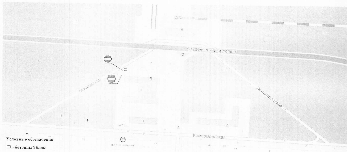
Схема организации движения транспортных средств на период проведения праздничных мероприятий «Масленица» 15.03.2024 с 16.00 часов по 18.03.2024 10.00 часов на территории города Дивногорска по ул. Московская, заезд на территорию ГДК «Энергетик»