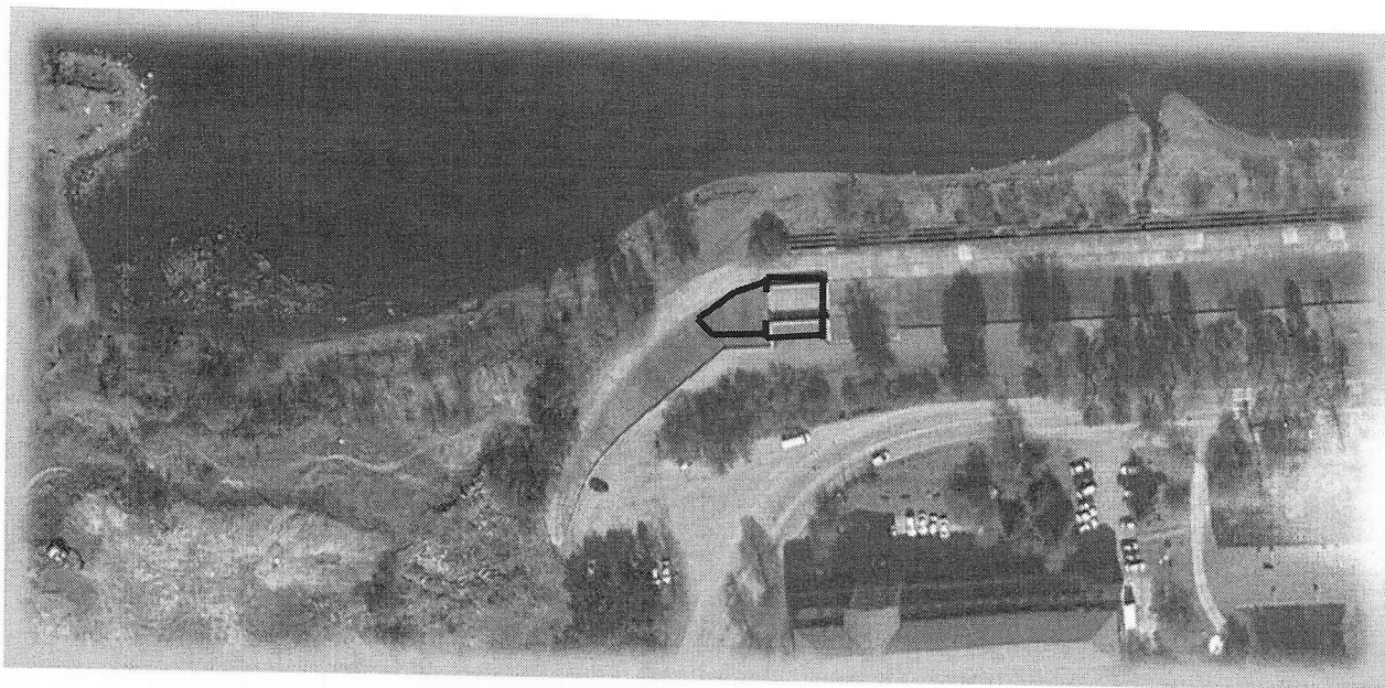
Схема размещения временного на земельном участке по адресу: г. Дивногорск, район ул. Набережной, 55, земельный участок 2/5