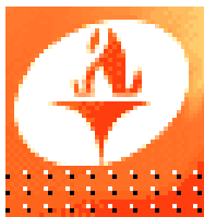
Схема теплоснабжения с 2013 до 2028 год Муниципального образования город Дивногорск Красноярского края

Общество с ограниченной ответственностью Производственно-коммерческое предприятие «ЯрЭнергоСервис»