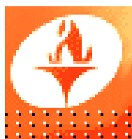
Схема теплоснабжения с 2013 до 2028 год города Дивногорска Красноярского края

Общество с ограниченной ответственностью Производственно-коммерческое предприятие «ЯрЭнергоСервис»