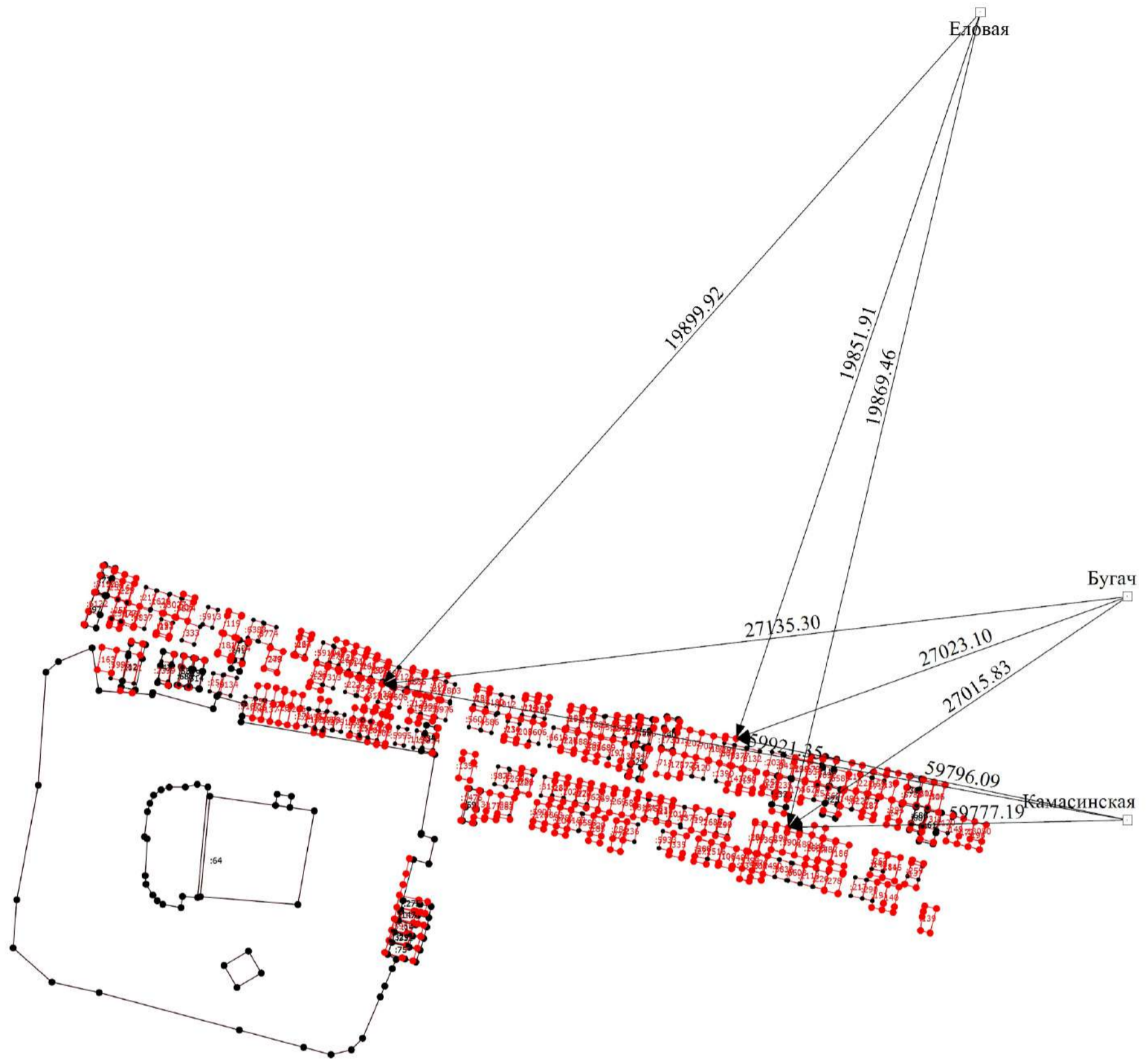
Схема геодезических построений