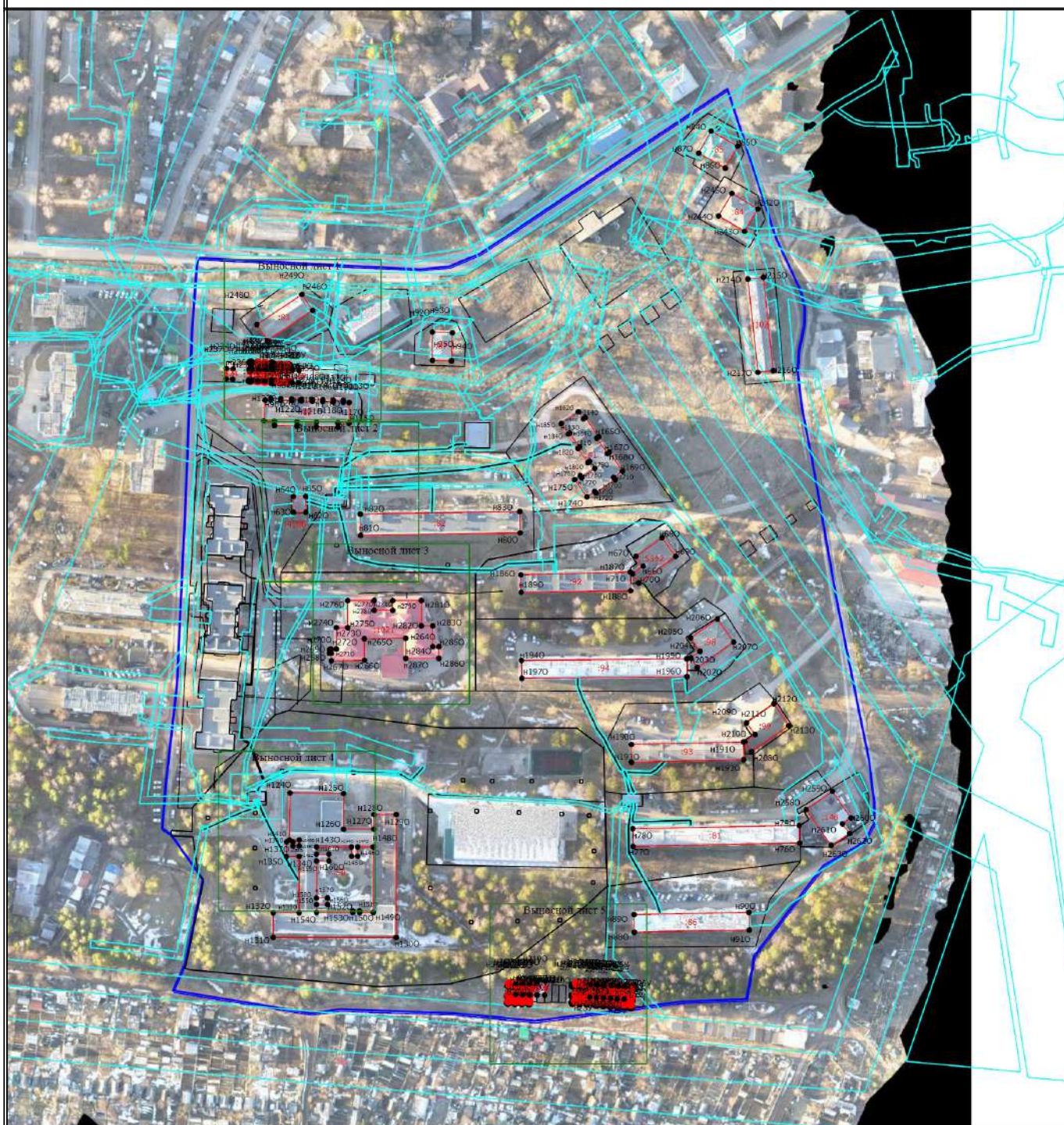
Схема границ земельных участков