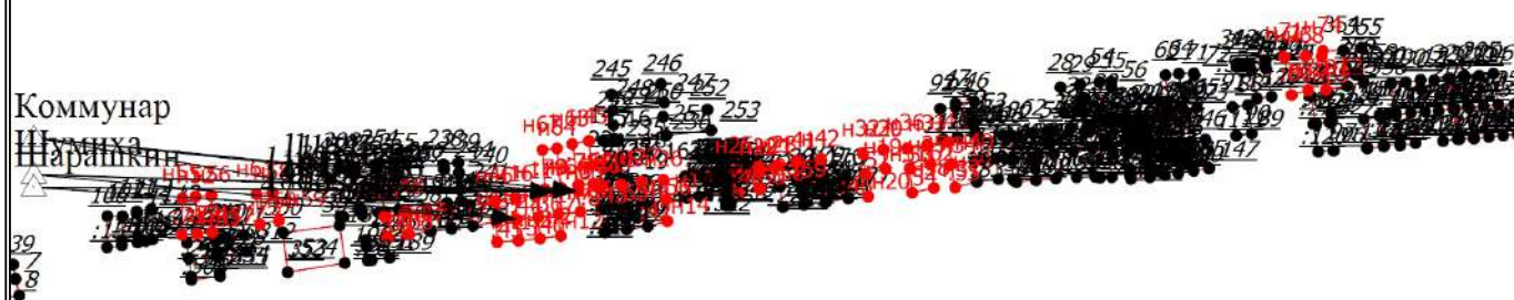
Схема геодезических построений