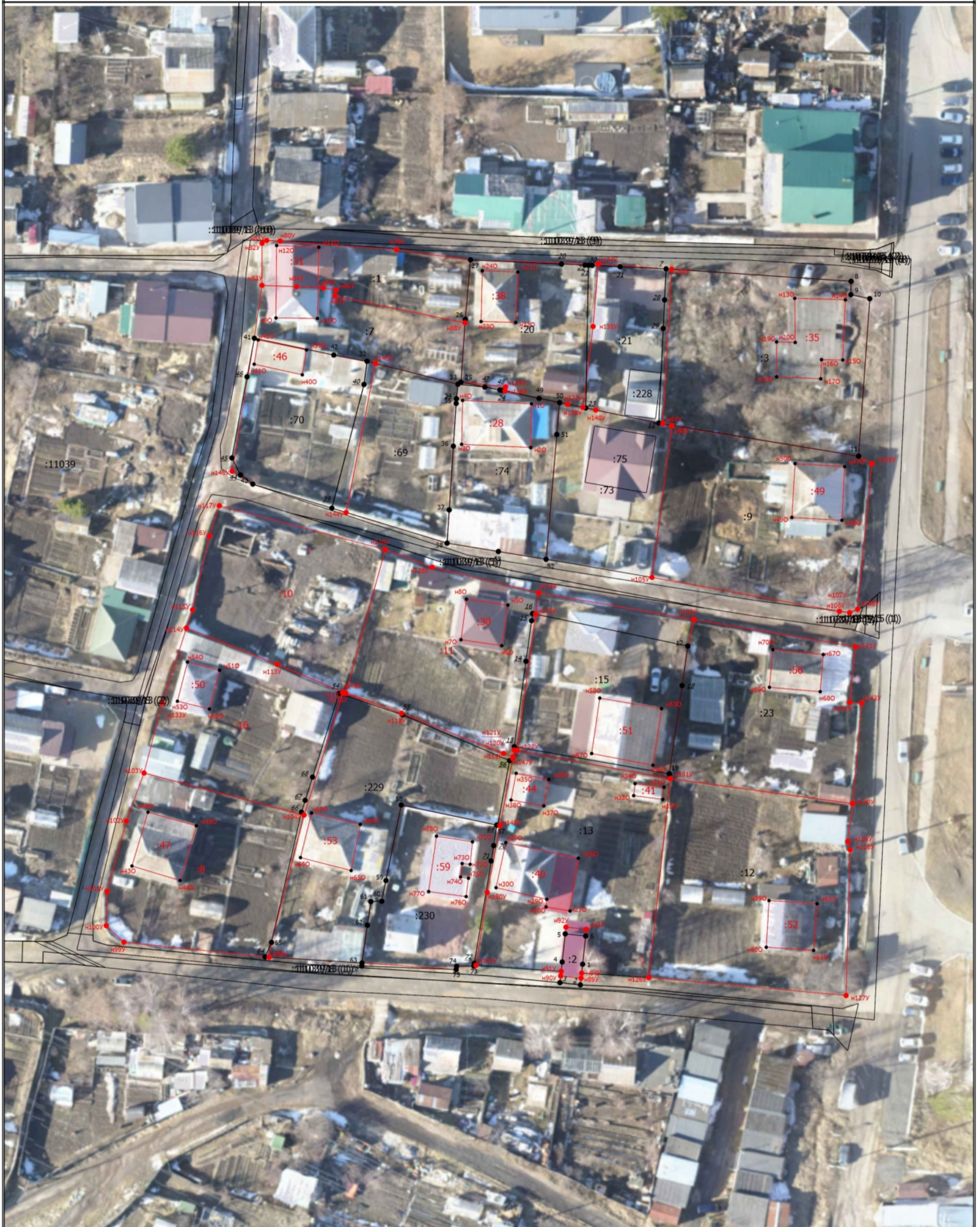
Схема границ земельных участков