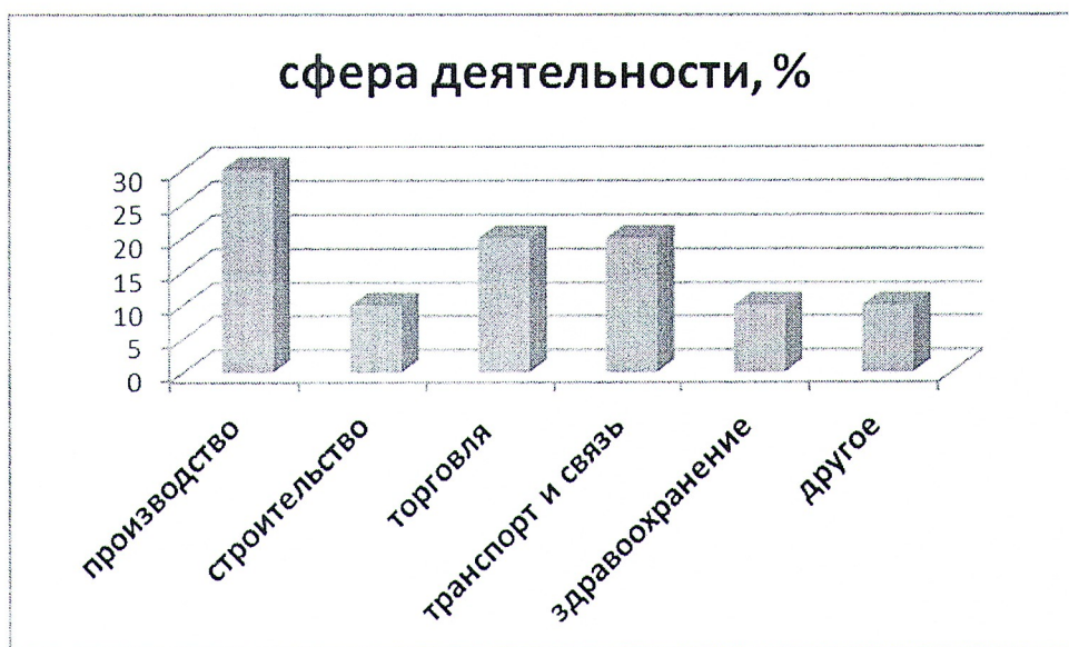
Рисунок 2 – Сфера деятельности респондентов в ГО город Дивногорск, % к опрошенным

сферу строительства, здравоохранения и другое по 10% прошедших анкетирование субъектов предпринимательской деятельности (Рисунок 2):