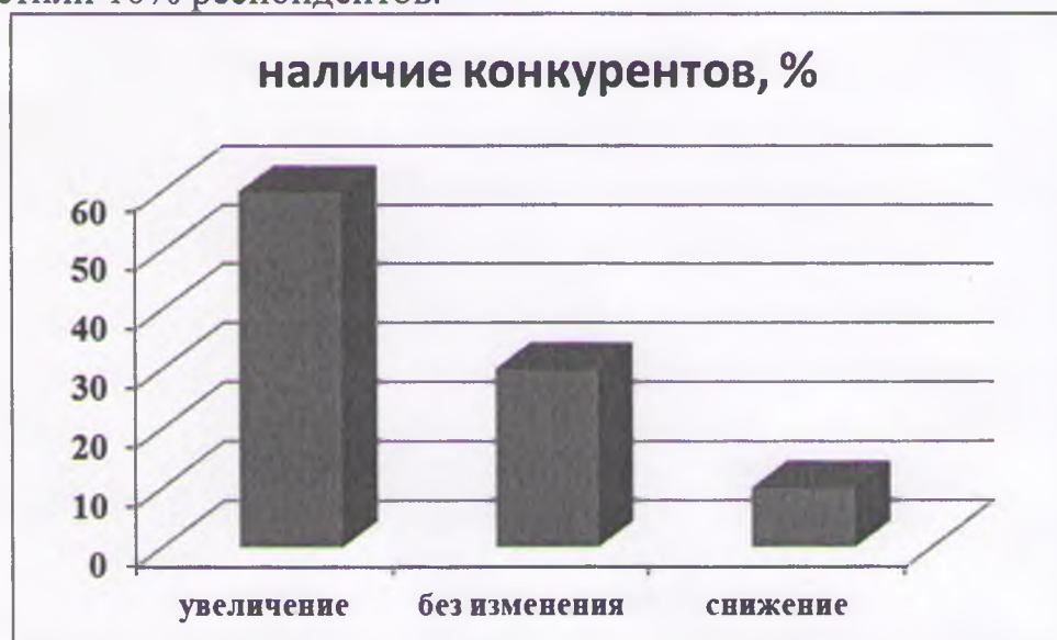
Рисунок 4 – Количество конкурентов предпринимателей, % к опрошенным

Существенным фактором функционирования бизнеса является наличие количества конкурентов у субъектов предпринимательской деятельности на основном рынке (рисунок 4). Так, на рост числа конкурентов указали 60% опрошенных, на отсутствие изменений в числе конкурентов в анализируемом периоде указали 30% опрошенных, сокращение числа конкурентов в целом отметили 10% респондентов.